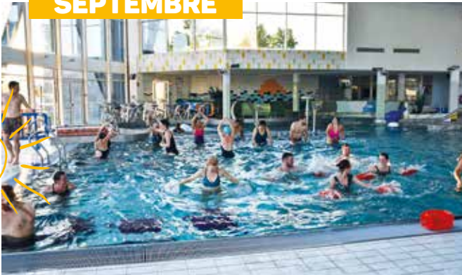
Lancement de la nouvelle activité "circuit training" : un succès immédiat auprès du public.