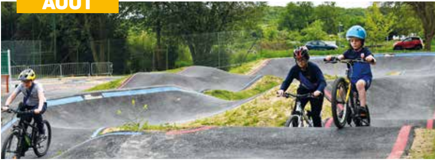
La pumptrack a enchanté les enfants durant toute la période estivale au parc Chédeville.