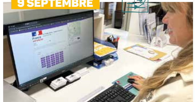
Prendre directement rendez-vous en ligne avec nos services, c'est désormais possible. Plus besoin d'appeler ni de vous déplacer.