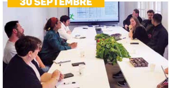
Visite du chantier d'insertion Les Pouces Verts à l'Hôpital Paul Doumer de Labruyère : l'occasion de faciliter les rencontres entre les acteurs de l'emploi du territoire, les services intercommunaux et les demandeurs d'emplois.