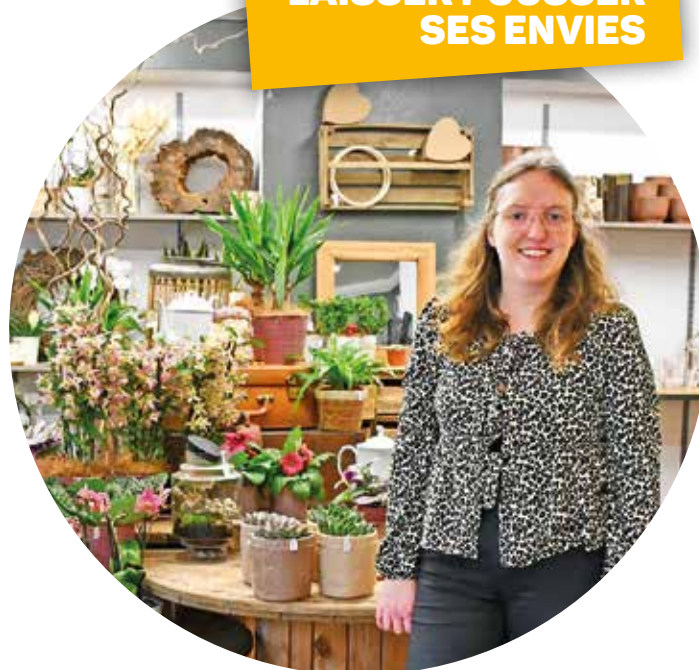
Tiphaine LAISSER POUSSER SES ENVIES

Comptoir des fleurs 262 rue de la République à Laigneville - 09 67 66 04 93 www.comptoirdesfleurs.com Facebook / Instagram : Comptoir des fleurs